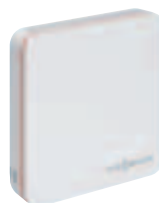
Termostat ViCare pre vyšší komfort a účinnosť