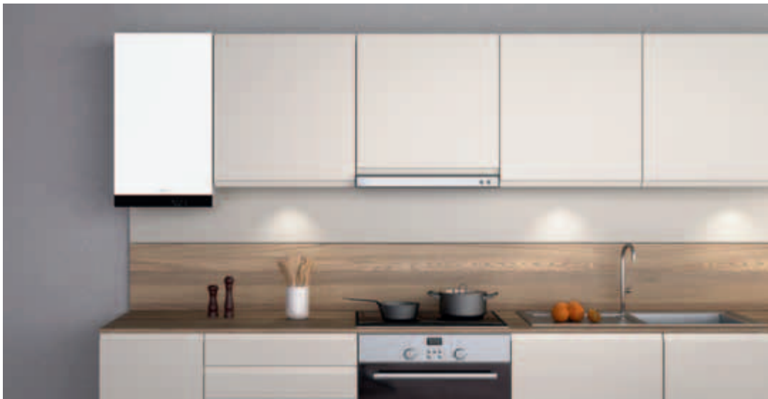
Vitodens 050-W v atraktívnom dizajne, farba Vitepearlwhite

Kompaktné a efektívne nástenné plynové kondenzačné kotly s mimoriadne zaujímavým pomerom ceny a výkonu.