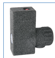
Takto pěkně vypadá: Kotlová Armatura Kombi 1962 Flex ve své izolaci

Kotlová Armatura Kombi 1962 Flex skóruje svou flexibilitou montáže, otočná i s nasazenou izolací. Garantována snadná údržba!