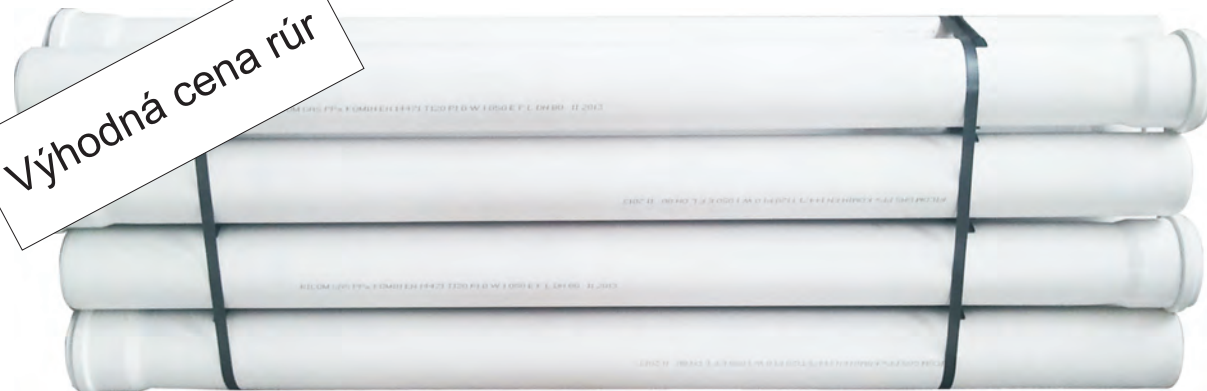
Komínová rúra plastová biela - výhodná cena