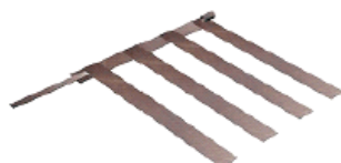
Vystreďovacia objímka jednoduchá